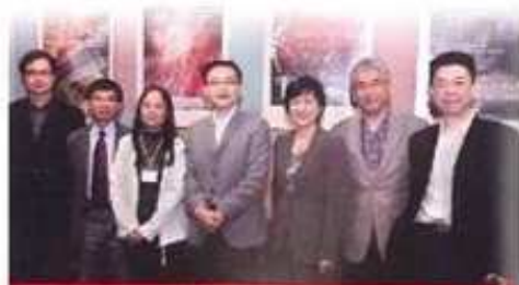
● 電影專業課程(高級文憑) 編劇及導演、電影製作管理、電影製作技巧(電影攝影、燈光與美術指導)、數碼媒體、影視表演(文憑)

本課程訓練學生專業的影視表演理論及技巧(形體、聲樂、台詞、舞蹈、方法演技等)。訓練學生成為具創作力的演員。畢業生可在業內從事和表演藝術相關工作。