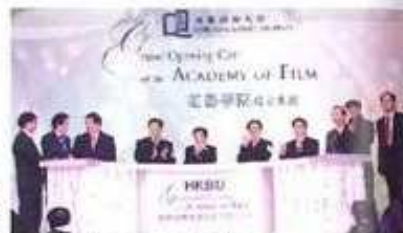
電影學院2009年九月舉行成立典禮

電影學院在行政上隸屬於傳訊學院(School of Communication)，與其新關係，傳訊學系在課程管理上，各有專長，又互相支持、協同發展。